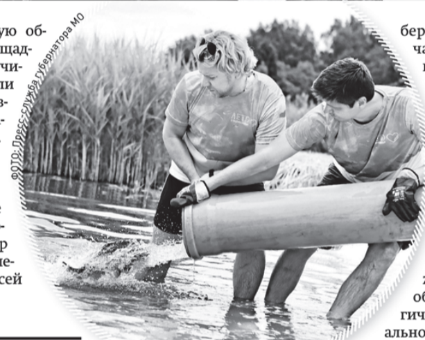
В озеро Сенеж выпустили почти две тонны карпов

В 2019 году форум стартует 5 июля, а закончит свою работу 20 августа. За шесть смен он примет более 6 тысяч участников со всей России. В данный момент завершается подготовка площадки. Лучше станут бытовые условия: жить участники «Территории смыслов» будут в домиках с удобными кроватями и кондиционерами, а не в палатках, как раньше. Оборудуют всем необходимым и саму территорию Мастерской – на